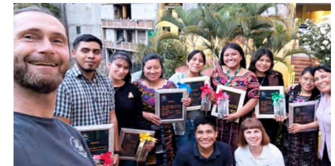
Ganz oben: Neugierig blicken die Kinder aus ihrem Klassenzimmer in der Volksschule Sechum. Darunter: Gruppenfoto mit unseren Ex-Stipendiat*innen samt Andenken an dieses Treffen.