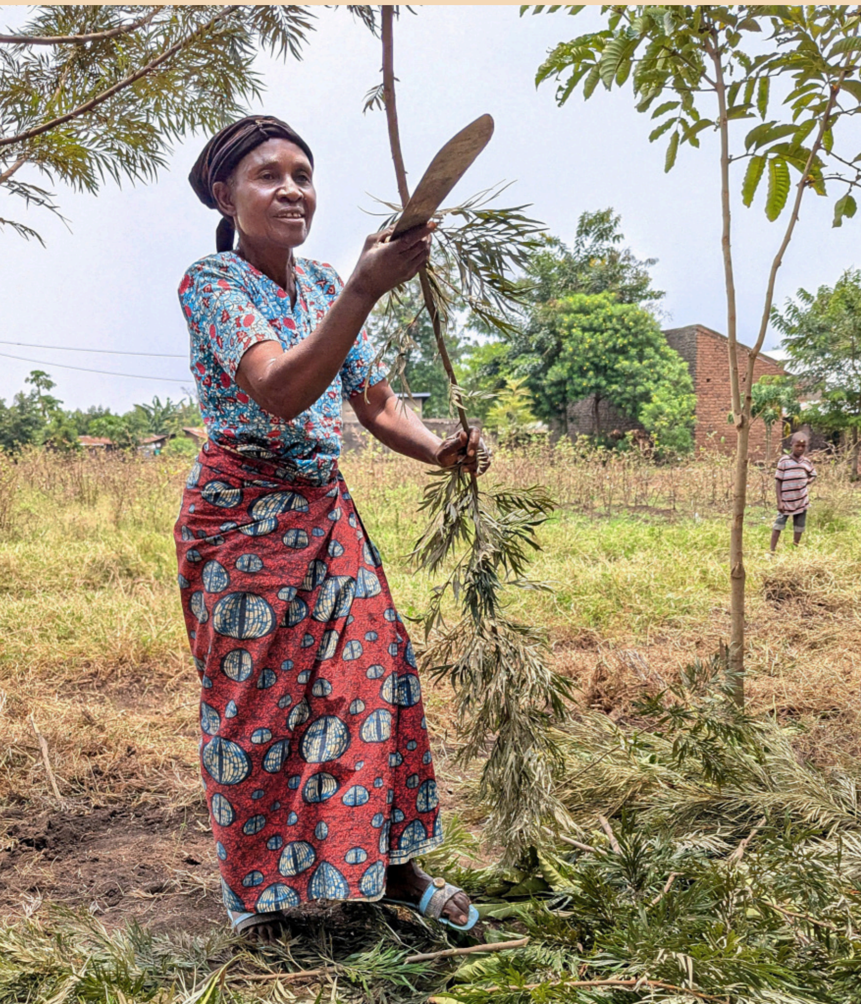
Brennholz zum Kochen