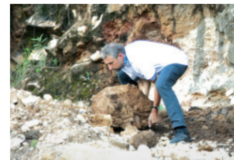
Manchmal Schwerstarbeit: Für die Weiterfahrt ins Projektgebiet musste die „Straße“ in Guatemala nach einem Hangrutsch freigeräumt werden.