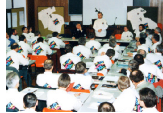
Zeichen der abgeschlossenen Strukturreform: die neuen Sei-So-Frei-Leibchen 1996 (oben); 1998 war das ugandische Nationalteam zu Gast in Österreich (unten).

Konkret wünsche ich dem Sei-So-Frei-Team ein gutes Standing in der Öffentlichkeit, eine transparente und ehrliche Wahrnehmung. Die qualifizierte