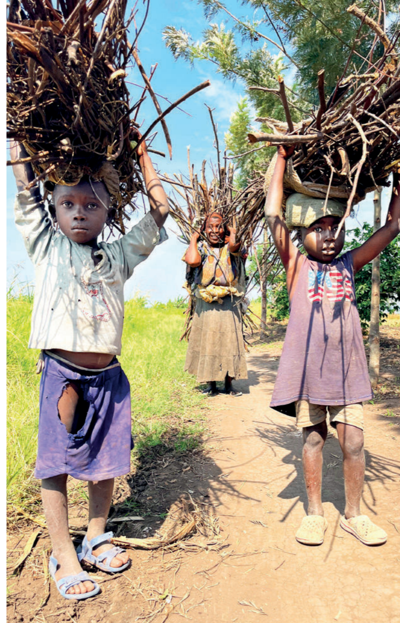
Bevölkerungswachstum und großflächige Abholzungen machten Holz zur Mangelware. Wiederaufforstungsprojekte helfen dabei, dass sich die Suche nach Brennmaterial einfacher gestaltet.

Vielfältige Vorteile. Eine gezielte Auswahl an Setzlingen sorgt dafür, dass die Menschen möglichst großen Nutzen aus den Pflanzungen ziehen können. Schnellwachsende Sorten sind ebenso gefragt wie dürreresistente. Und das Potenzial der Bäume ist groß: Sie stabilisieren den Boden und dienen als Windschutz. Sie liefern, wie bereits erwähnt, Brennholz, Schatten und Früchte. Spezielle bienenfreundliche Pflanzen